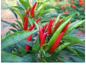
พริก เป็นคำตาย

ตอนที่ ๑ ให้นักเรียนบอกชื่อภาพที่เห็นและวิเคราะห์ว่าเป็นคำเป็นหรือคำตาย