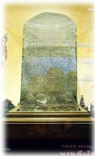
TAKKIE AKZIMA พจนานุกรม