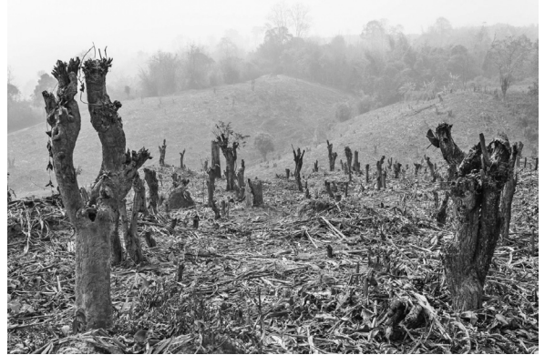
ปัจจุบัน