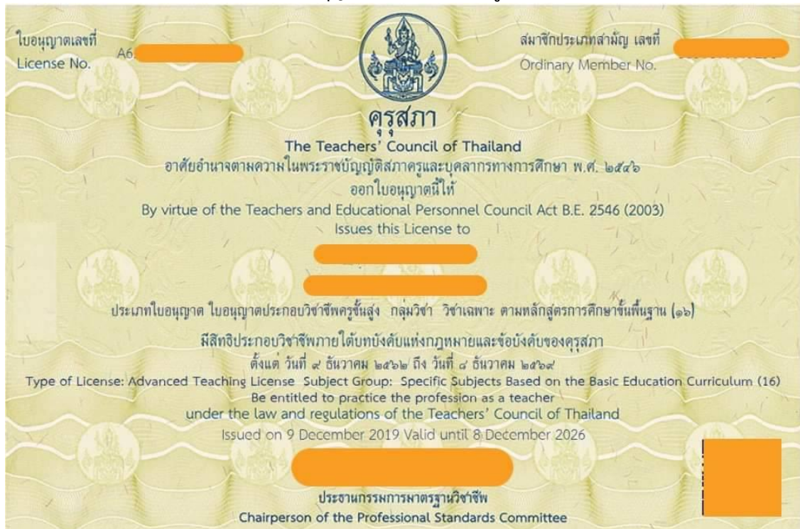
๔. ใบอนุญาตประกอบวิชาชีพครูชั้นสูง